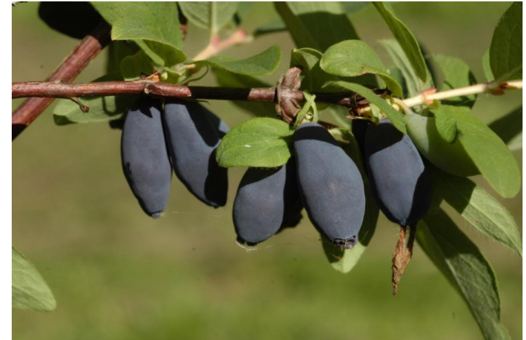
Boreal Blizzard