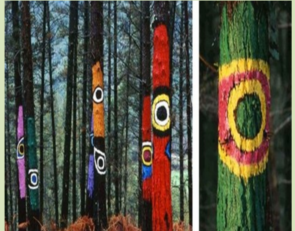
Schulprojekt Grundschule Halblech