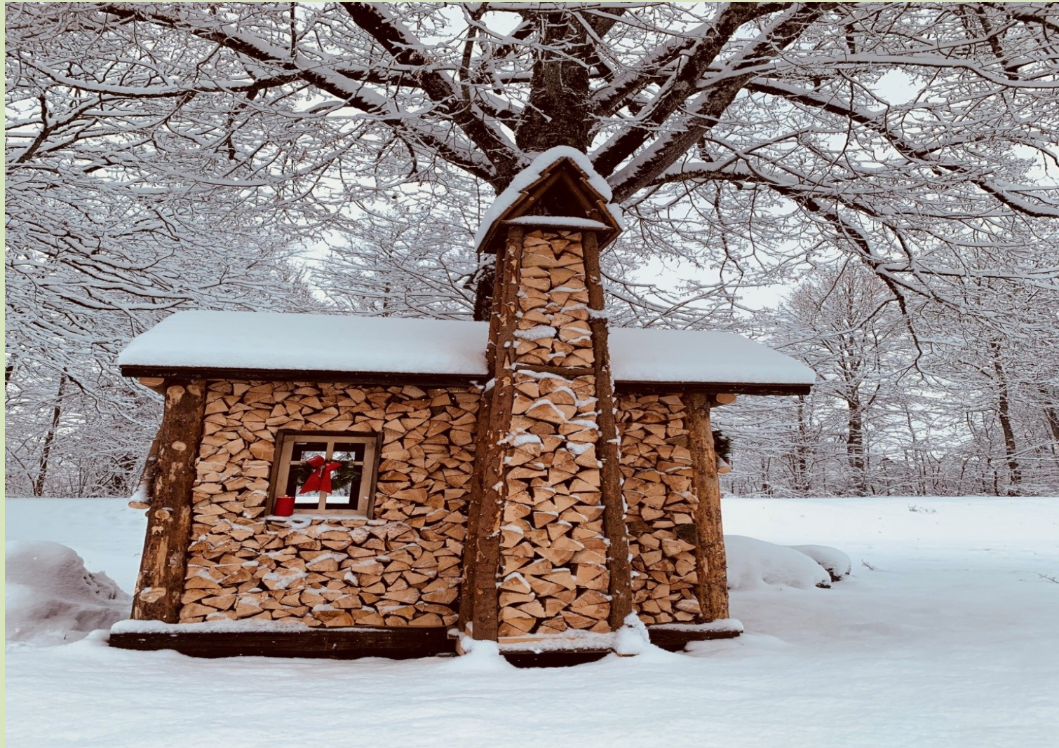
Jungrentner SC Halblech