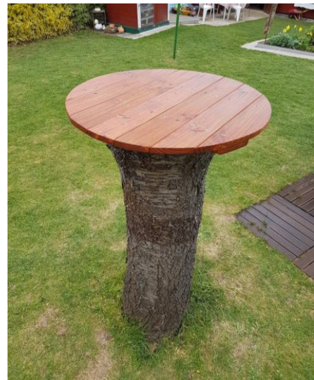
Abb. 4: Garten-Stehtisch aus Baumstumpf. BOSCH 2017.

Dass meine Erfahrungen im heimischen Garten keine Ausnahme sind, zeigt auch die Statistik: In Bayern gibt es heute rund 70 Prozent weniger Obstbäume als im Jahr 1965 (vgl. LANDKREIS