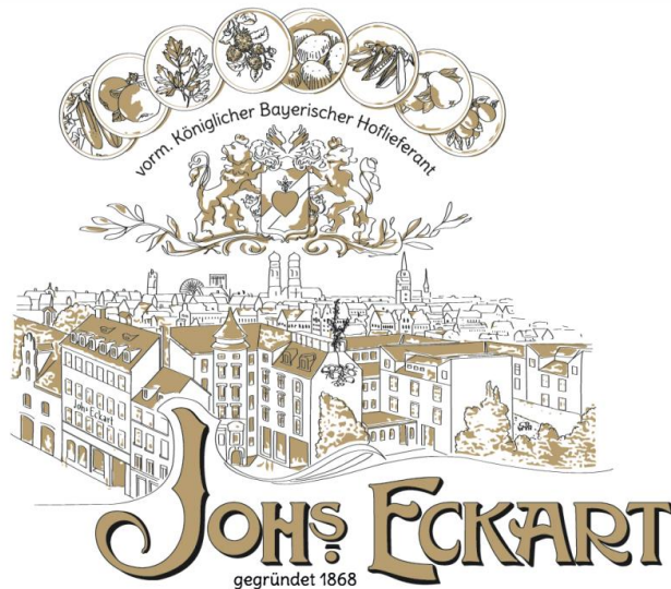
Abb. 1: Logo der Joh's Eckart GmbH. URKERN, 2023.

Mittlerweile ist die Joh's Eckart GmbH eine angesehene Anlaufstelle für Nachhaltigkeitsberatung, die sowohl Unternehmen, Kommunen als auch Quartiere umfasst. Ein besonderes Highlight in diesem Beratungsportfolio bildet das Klimaschutzbündnis Werksviertel-Mitte. Dieses einzigartige Bündnis bietet Firmen und institutionellen Einrichtungen die Möglichkeit, aktiv an Maßnahmen im Bereich des eigenen Klima- und Umweltschutzes teilzunehmen.