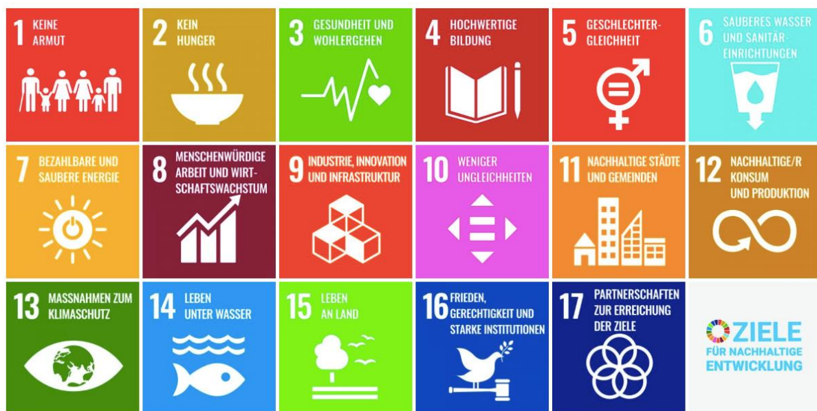
Abb. 3: Die Ziele für nachhaltige Entwicklung. VEREINTE NATIONEN, 2023.

Die folgenden 17 Ziele wurden von den Vereinten Nationen entwickelt mit dem Ziel, bis 2030 nachhaltige Entwicklung auf wirtschaftlicher, sozialer und ökologischer Ebene zu fördern: