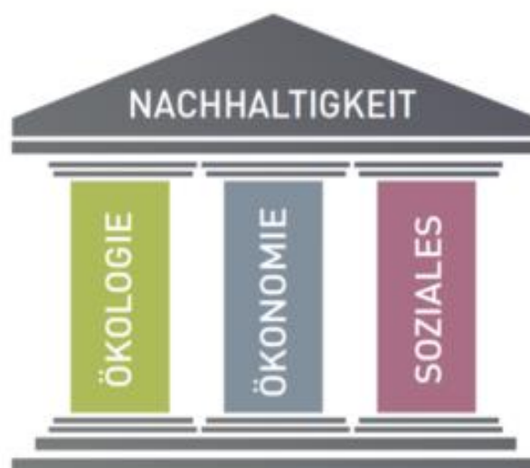
Abb. 2: Die drei Säulen der Nachhaltigkeit. INSTITUT BAUEN UND UMWELT E.V., 2020.

Nachhaltigkeit bezieht sich also auf die Fähigkeit, langfristige Bedürfnisse der heutigen Gesellschaft zu erfüllen, ohne die Ressourcen und Umwelt für zukünftige Generationen zu gefährden. Diese Konzeption basiert auf ökonomischen, sozialen und ökologischen Faktoren, die auch als "drei Säulen der Nachhaltigkeit" bezeichnet werden.