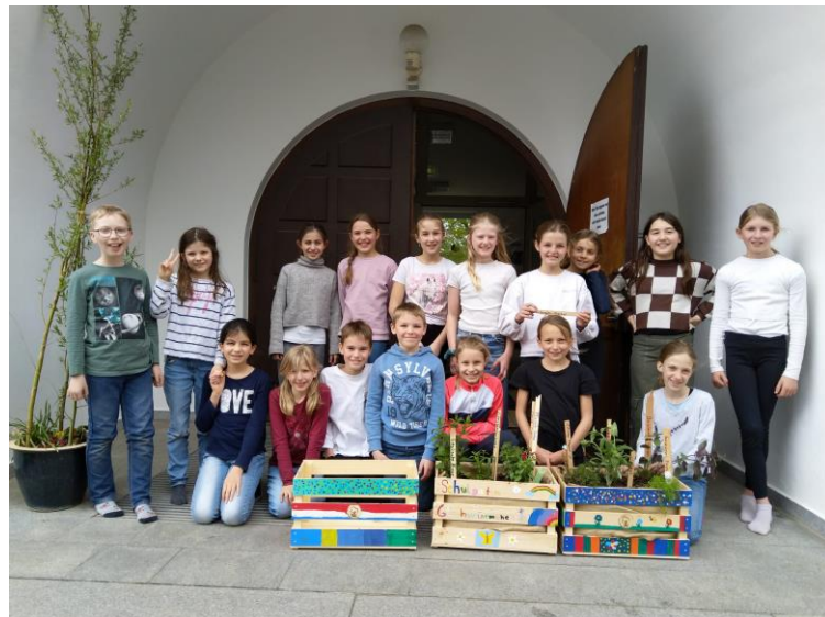
Unsere Grashüpfer, 13-15 Jahre alt