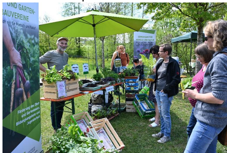
Stand des Kreisverbands

Auch der Pflanzentausch wurde in diesem Jahr mit Ausstellern „aufgewertet“, die Informationen für Garteninteressierte boten oder Angebote, die zum Garten passen.