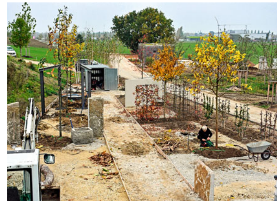
Blick von der Dachterrasse des Pavillons in den stetig wachsenden Lehrgarten. (Aufnahme im Oktober 2019)