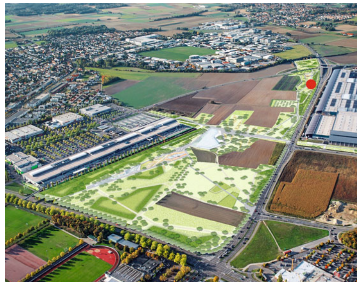
Übersicht über das neu entstehende Gartenschau Gelände im Norden von Ingolstadt zwischen Westpark (links) und der Audi GVZ-Halle (rechts oben). Der Beitrag der oberbayerischen Gartenbauvereine befindet sich im Norden (roter Punkt).